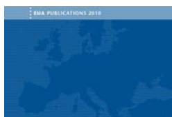
Trends 2010: A decade of change in European Higher Education BY ANDREW GURDICK & NADINE SHOOT

Die European University Association (EUA) hat im sog. „Trends 2010-Report“ neue Befunde zur Entwicklung des Bologna-Prozesses in den 47 Teilnehmerländern veröffentlicht. Demnach haben in den Teilnehmerländern 95 % aller Hochschulen die neuen Studiengänge eingeführt. Die Richtung des in Deutschland bereits laufenden Nachsteuerungsprozesses wird bestätigt: Im Zieljahr bestehen vor allem noch Defizite bei der Finanzierung, der Gestaltung der Studienprogramme und der Anerkennung von Studienleistungen.